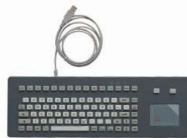
Tastatur + Touch