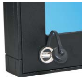
frontseitiger IP65 USB-Anschluss