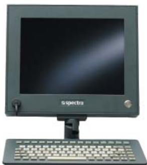
Spectra-Panel Silent-wSL 1232 mit montierter Tastatur